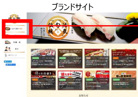
寿司 テイク TOP ページ