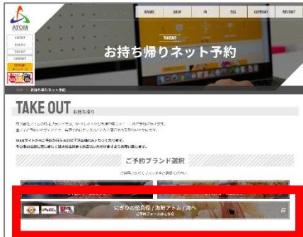
コーポレートサイト (TAKE OUT)