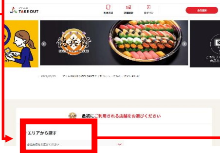
寿司 テイク TOP ページ